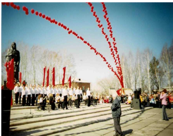
Мужской хор колледжа 2006 г.

индивидуального обучения музыке, в колледже эта работа заметно снизилась. Но коллектив делает все возможное для приобщения студентов к миру прекрасного. Не случайно с момента зарождения фестивального движения «Студенческая весна» в области колледж постоянный победитель муниципального уровня, победитель и призер областного этапа этого фестиваля последних лет. Наши студенты два года подряд стали участниками Всероссийского этапа «Студенческая весна».