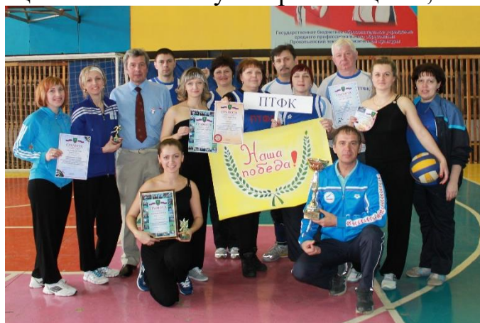
Спартакиада педагогов 2015.

Техникум не раз входил в число победителей Всероссийской акции «Зарядка с чемпионом» в номинации «За отличную организацию», на протяжении 4-х лет техникум стабильно побеждал и занимал 1-е место в областной Спартакиаде педагогических работников профессиональных образовательных организаций Кемеровской области. Техникум прочно завоевал репутацию учебного заведения, выпускающего только высококвалифицированных специалистов, ведь его главный девиз сегодня: «Мы учим побеждать!».