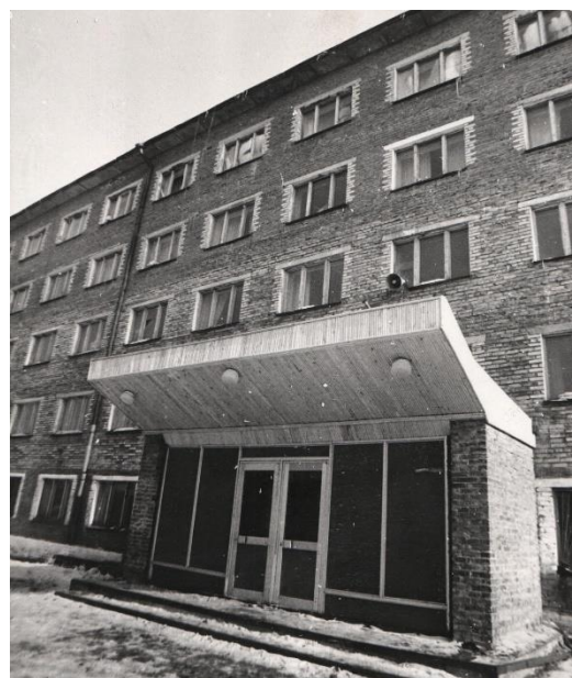
Фасад ТФК, 1975г.