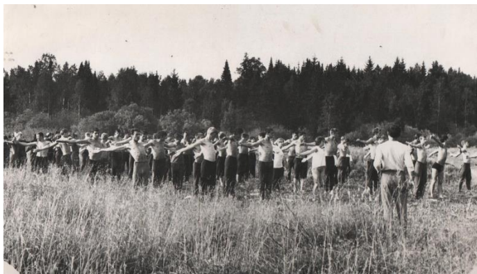
Тренировки в турпоходе

Пора студенчества в памяти у всех осталась ярким и незабываемым временем. Столько интересных событий происходило, счастливые годы обучения пролетели очень быстро, но они запомнились на всю жизнь, ведь эти студенческие годы проходили в ПТФК, где руководство старалось всё делать для студентов. Сборные команды техникума по избранным видам спорта имели все возможности вести круглогодичный