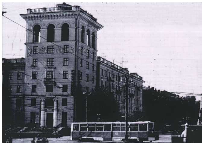
Город Прокопьевск, 1965г.

Свой исторический путь Прокопьевский техникум физической культуры начал в 1965 году. Прокопьевск в те годы развивался, расширялся и активно строился. Благодаря тому, что в городе открывались предприятия угольной, машиностроительной, металлургической промышленности, увеличивалось население, шел приток рабочей силы, строилось жилье для работников города, объекты культурного назначения и, конечно же, спортивные сооружения. В начале 60-х годов стали создаваться районные советы по развитию физкультуры и спорта. В каждом производственном коллективе работали инструкторы по физкультуре и спорту, в городе появились футбольная и хоккейная команды «Шахтер». Спортивная жизнь особенно забурлила после строительства в городе стадиона «Шахтер», в районах функционировало 7 футбольных полей, а зимой более 30 хоккейных коробок. Горком разработал долгосрочную программу развития физкультуры и спорта, а главной ее целью была Спартакиада трудовых коллективов по летним и зимним