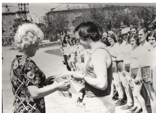
Соревнования студентов ТФК 60-х годов

Шестидесятые годы шагали под лозунгом «От массовости - к мастерству и совершенству». Именно массовость тогда явилась той благодатной почвой, на которой росли будущие рекордсмены и чемпионы. Учащиеся техникума в те годы принимали участие во всех городских и областных соревнованиях, матчах, турнирах, часто завоевывали призовые места. Они не раз побеждали в традиционных легкоатлетических эстафетах на приз газеты