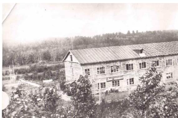
Первое здание ТФК, 1965г.

Первое здание техникума находилось в деревянном бараке довоенной постройки. Техникум не имел своей спортивной базы, учащиеся занимались в непригодных аудиториях, практические занятия и тренировки