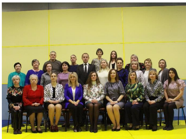
Педагогический коллектив ПТФК

конкурсов, Всероссийских и международных научно-практических конференций, они являются активными участниками Всероссийских акций и конкурсов профессионального мастерства. Преподаватели техникума физической культуры - всесторонне развиты и образованны, они не только