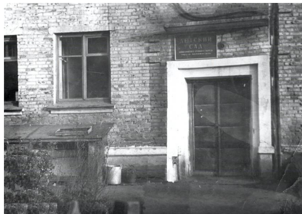
Рис.1. ясли-сад № 25 «Солнышко», 1962г

21 октября 1962 - «Колмогоровский» угольный разрез ОАО «Беловоуголь» открыл первый на поселке ясли-сад № 25 «Солнышко». Он состоял из основного здания и филиала. Всего групп было 8 ( 5 в основном здании и 3 в филиале) Данный детский сад был рассчитан на 250 мест. Обслуживало детский сад 48 сотрудников.