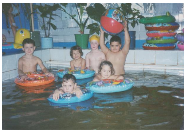
Рис.15 Бассейн, МБДОУ детский сад № 25 города Белово, 2011г