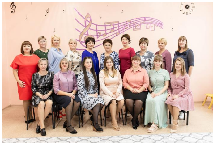
Рис.17 Коллектив педагогов 2023г

Наш детский сад сегодня — стабильное, успешное и развивающееся в соответствии с современными тенденциями дошкольное учреждение, а Коллектив идет в ногу со временем, учится и профессионально растет.