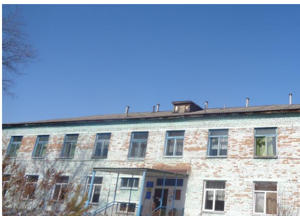
Рис. 14 МБДОУ детский сад № 25 города Белово, 2009г