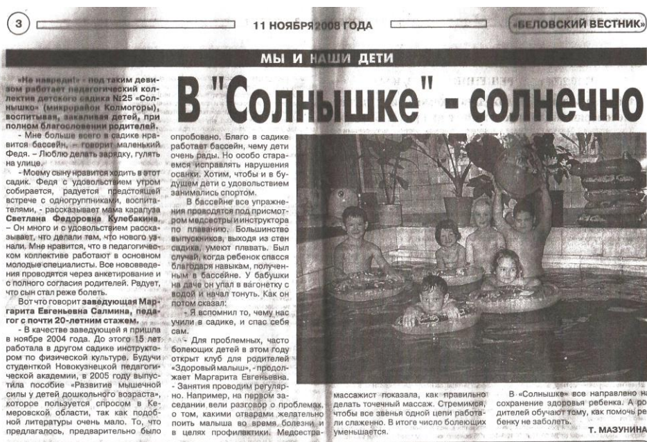
Рис. 16 Статья «Беловский вестник», 2008г

Наш детский сад сегодня — стабильное, успешное и развивающееся в соответствии с современными тенденциями дошкольное учреждение, а Коллектив идет в ногу со временем, учится и профессионально растет.