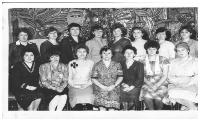
Рис.2 Первый коллектив ясли-сад № 25 «Солнышко», 1962г