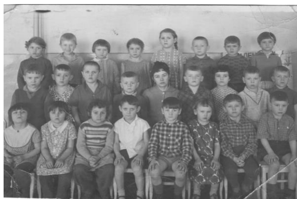
Рис.3 Первые выпускники ясли-сад № 25 «Солнышко»