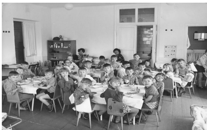
Рис. 4. Прием пищи., 1963г