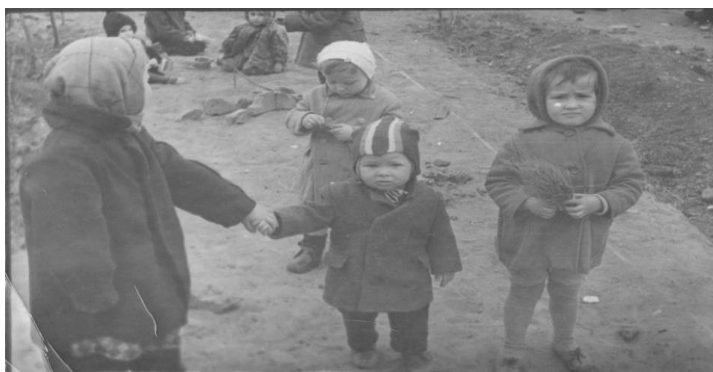
Рис. 6 Прогулка