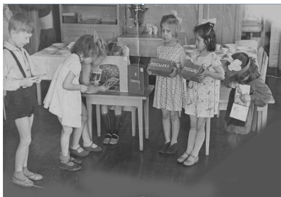
Рис. 5. Игра в действии