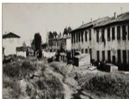
1941 – 1945гг