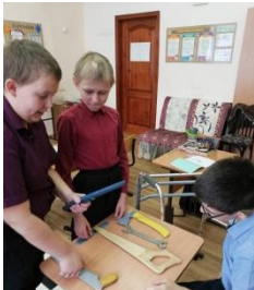
сто дорог – одна моя

Педагоги, неравнодушные люди к чужим проблемам, и нас этому учат: своими советами, своим примером: в школе есть волонтерское движение, где мы помогаем одиноким престарелыми жителям поселка Сыркаши. Также ведется с нами работа по профориентации «Сто дорог - одна моя», это нам поможет в дальнейшей жизни, чтобы получить профессию, работать и приносить пользу обществу! Один из любимых предметов, это