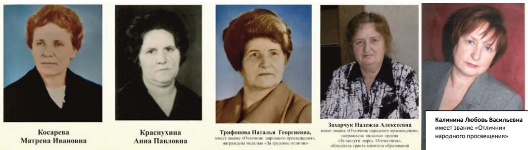
Фото первых директоров

И во все времена здесь работали неравнодушные, трудолюбивые, талантливые педагоги, преданные своему делу. Они не считают ни рабочего времени, ни личного – помогают, опекают, подсказывают, заботятся.