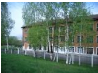
Школа "Коррекция и развитие"

Сегодня, я хочу рассказать вам о моей школе, мне здесь всегда уютно, радостно, позитивно, и просто хорошо... Рассказать о истории школы, о педагогах: они разные, но их всех объединяет любовь детям.