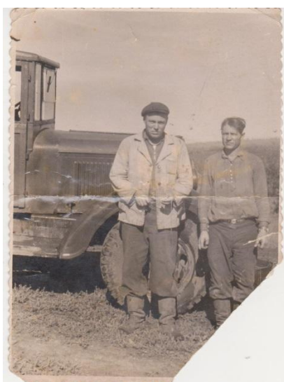
Первая машина – полуторка

Маленькая полуторка-ЗИС-5, ГАЗ-51, ЗИЛ, на всех машинах, иногда и на тракторах, показывал прадед свое мастерство. Куда только он не ездил: на уборочные и посевные по всему району, иногда отправляли на уборочную в Новосибирскую область, Горный и Степной Алтай, в отдаленные районы Кемеровской области. За высокие показатели на уборке урожая на Алтае, он получил благодарность, премию и ковер.