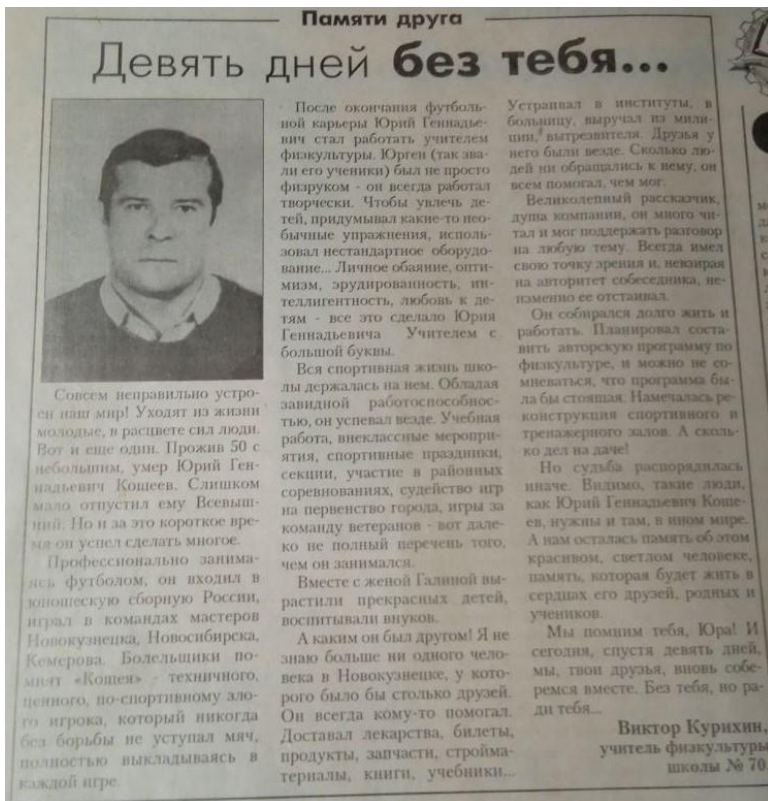
Статья в газете "Кузнецкий рабочий". 2000 г.