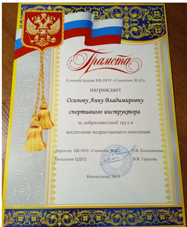
Грамота. МБ НОУ “Гимназия №62”. 2015 г.

С первого по седьмой класс я обучалась в гимназии №62. Успевала в учёбе, занималась спортом и выступала за школу на различных соревнованиях по баскетболу.