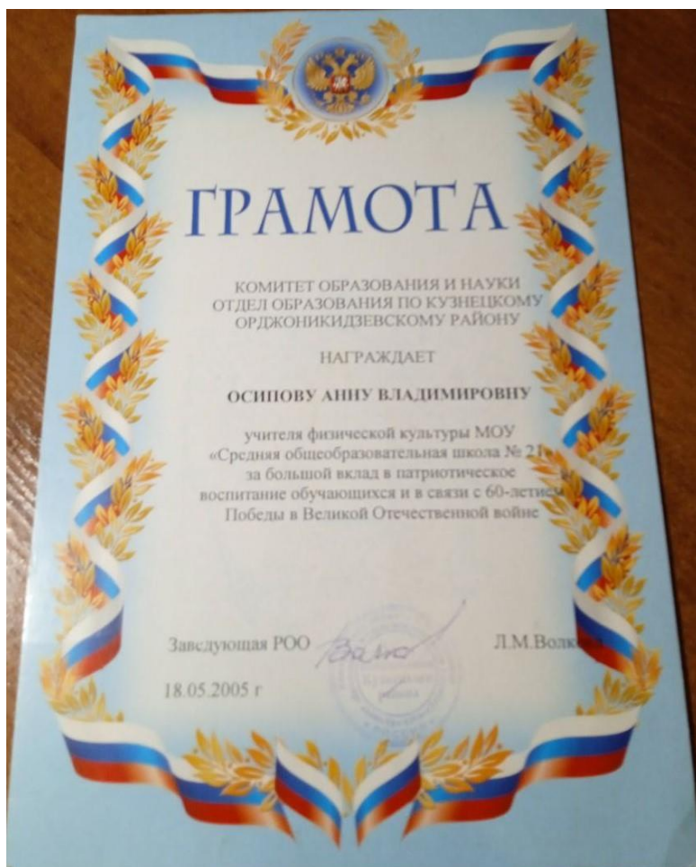
Грамота. МБОУ “СОШ №21”. 2005 г.