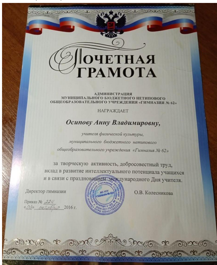
Грамота «Гимназия №62» 2016 г.

Именно моя мама и мой крёстный привили мне любовь к спорту. Я с первого класса занималась в секции по баскетболу, а с четвёртого уже выступала за школьную сборную девушек. К сожалению, получив травму, мне пришлось закончить свою спортивную карьеру, которая была только в самом разгаре.