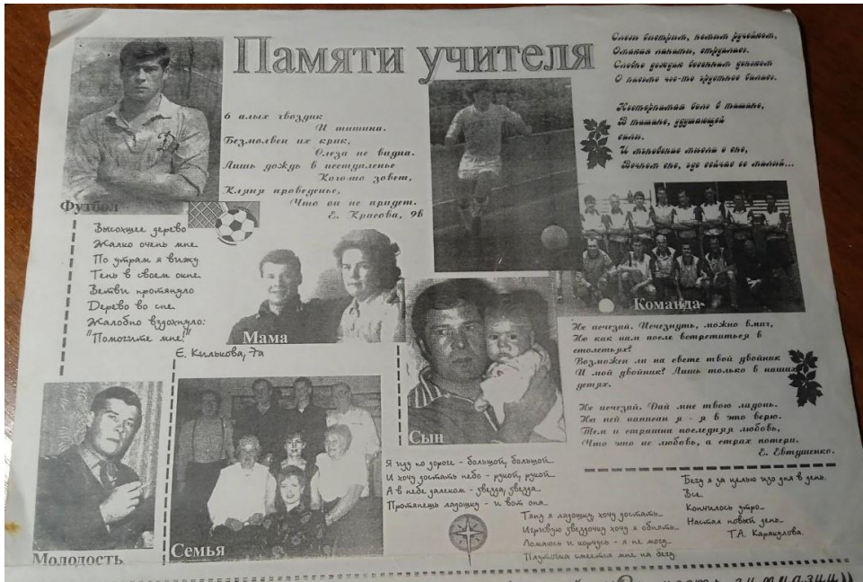
Колонка из школьного журнала "Вместе", 2001 г.