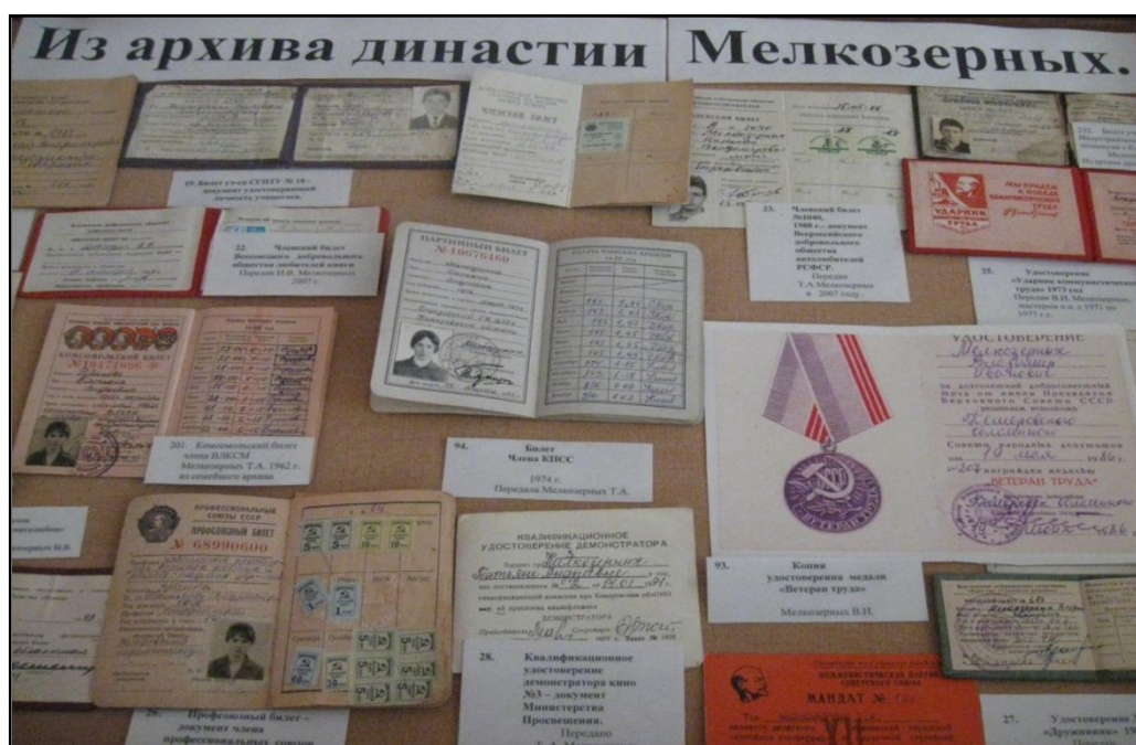
Фото экспозиции музея «Вирази времени»

В нашем музее «Вирази времени» семье Мелкозерных отведено особое место.