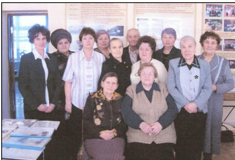
Встреча в музее

«Вирази времени», а теперь работает с ветеранами.