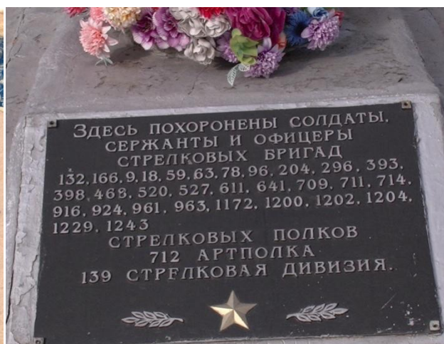
Фотография Братской могилы «Курган» г.Ржев