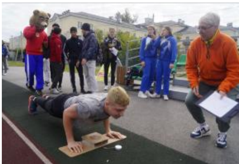
Ежегодно мы участвуем в испытаниях Всероссийского физкультурно-спортивного комплекса «ГТО»

Мы выбрали физическую культуру и спорт сферой своей профессиональной деятельности и отлично понимаем, что нам принадлежит важная роль в вовлечении жителей нашего города и родного Кузбасса в различные виды двигательной активности. У нас широкое профессиональное поле. Выпускники УОР Кузбасса работают не только в спортивных школах тренерами-преподавателями. В фитнес-клубах, спортивных комплексах, техникуме, общеобразовательных школах и даже в детских садах есть влюбленные в свою специальность выпускники нашего техникума.