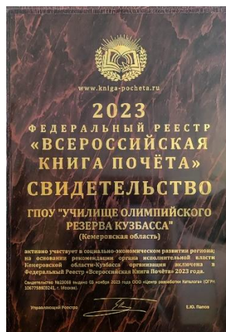
Свидетельство Федерального реестра «Всероссийская книга почета»

За время существования ГПОУ «Училищеолимпийского резерва Кузбасса» обучающиеся и выпускники завоевали 626 медалей различного достоинства на всероссийских и международных соревнованиях.