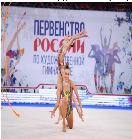
Фото 3. Соревнования

Я имею спортивный разряд «Кандидат в мастера спорта» по художественной гимнастике, вхожу в состав сборной команды Кемеровской области, являюсь победителем и призером Всероссийских соревнований. В 2021 году награждена медалью «Надежда Кузбасса».