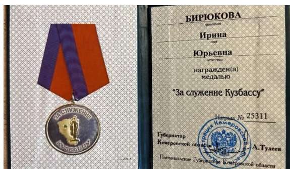
Фото 6. Награда бабушки.