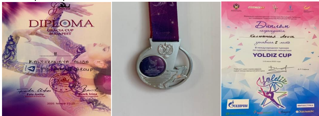
Фото 7,8,9. Самые яркие победы.

Общий тренерский и спортивный стаж нашей семьи более 350 лет! Я очень горжусь тем, что являюсь частью нашей семейной спортивной династии. Я тоже очень хочу стать тренером и продолжить дело, которое начала моя прабабушка.