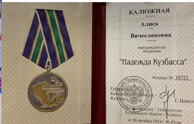
Фото 4. Моя награда

Я хочу рассказать Вам о нашей спортивной семье. Начну со своего (четвертого) поколения.