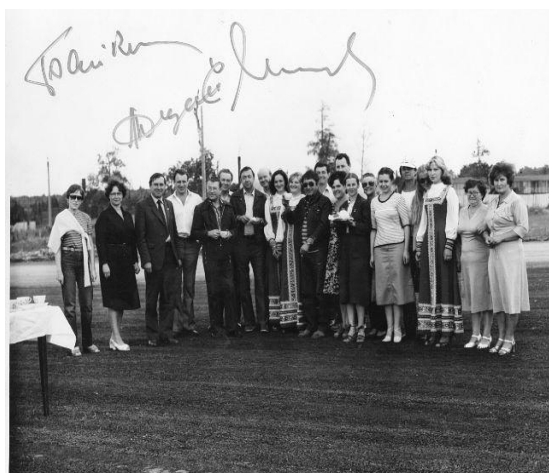
Фото 2. Встреча артистов Московского театра сатиры