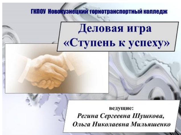
Рисунок 2 - Проведение деловой игры «Ступень к успеху»

Экспертирование резюме проводилось работодателями для отражения пунктов наиболее значимых при его рассмотрении.