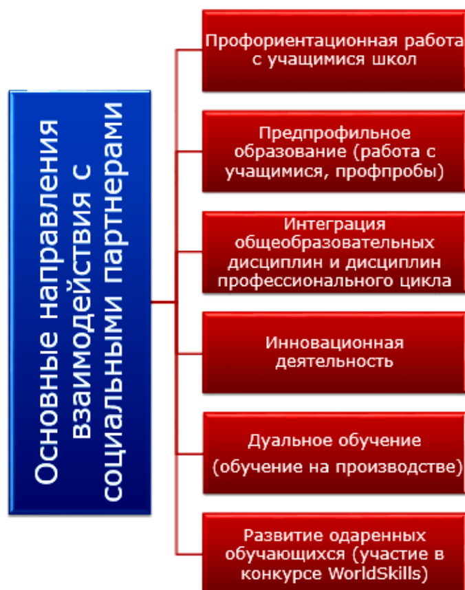
Рисунок 2 - Основные направления взаимодействия с социальными партнерами

3 этап. Формирование целей, задач, принципов, совместной работы.