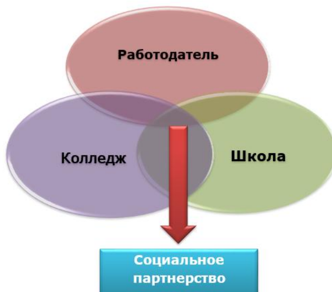
Рисунок – 1 Схема организации социального партнерства

Схема организации социального партнерства представлена на рисунке 1.