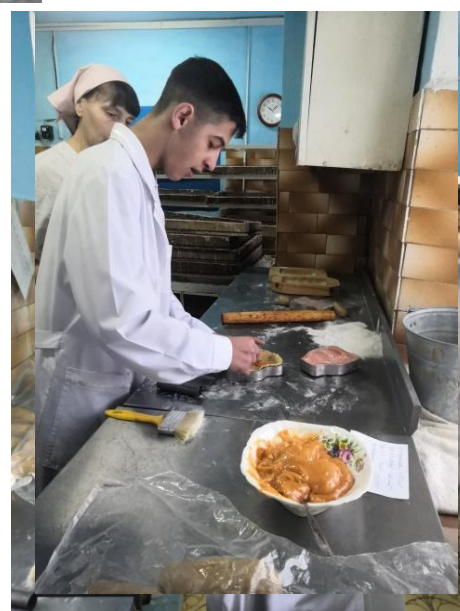
Рис. 4,5 Прохождение профпробы на Гурьевском пищекомбинате