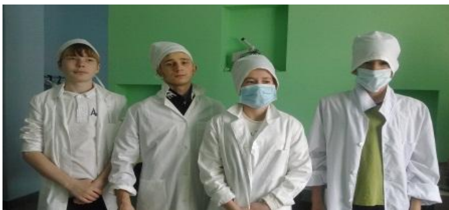
рис. 1 знакомство с профессией медсестры во время экскурсии в дневной стационар городской поликлиники будущие выпускники познакомились с профессиям:

медицинская сестра, фельдшер, лаборант. Особенно интересно было примерить на себя профессию медицинского работника: измерять артериальное давление, изучать медицинский инструмент. Воспитанники получили подробную консультацию о правилах приёма в медицинский колледж. Некоторые задумались о выборе благородной профессии.