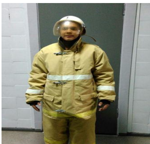
Рис.6 Знакомство с профессией Пожарный (будущих выпускников) подробно познакомили с этой сложной профессией