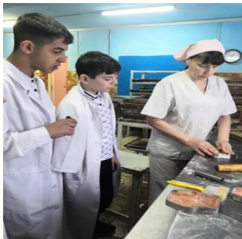
рис.2,3 Знакомство с профессией кондитера на ОАО «Пищекомбинат» г.Гурьевска